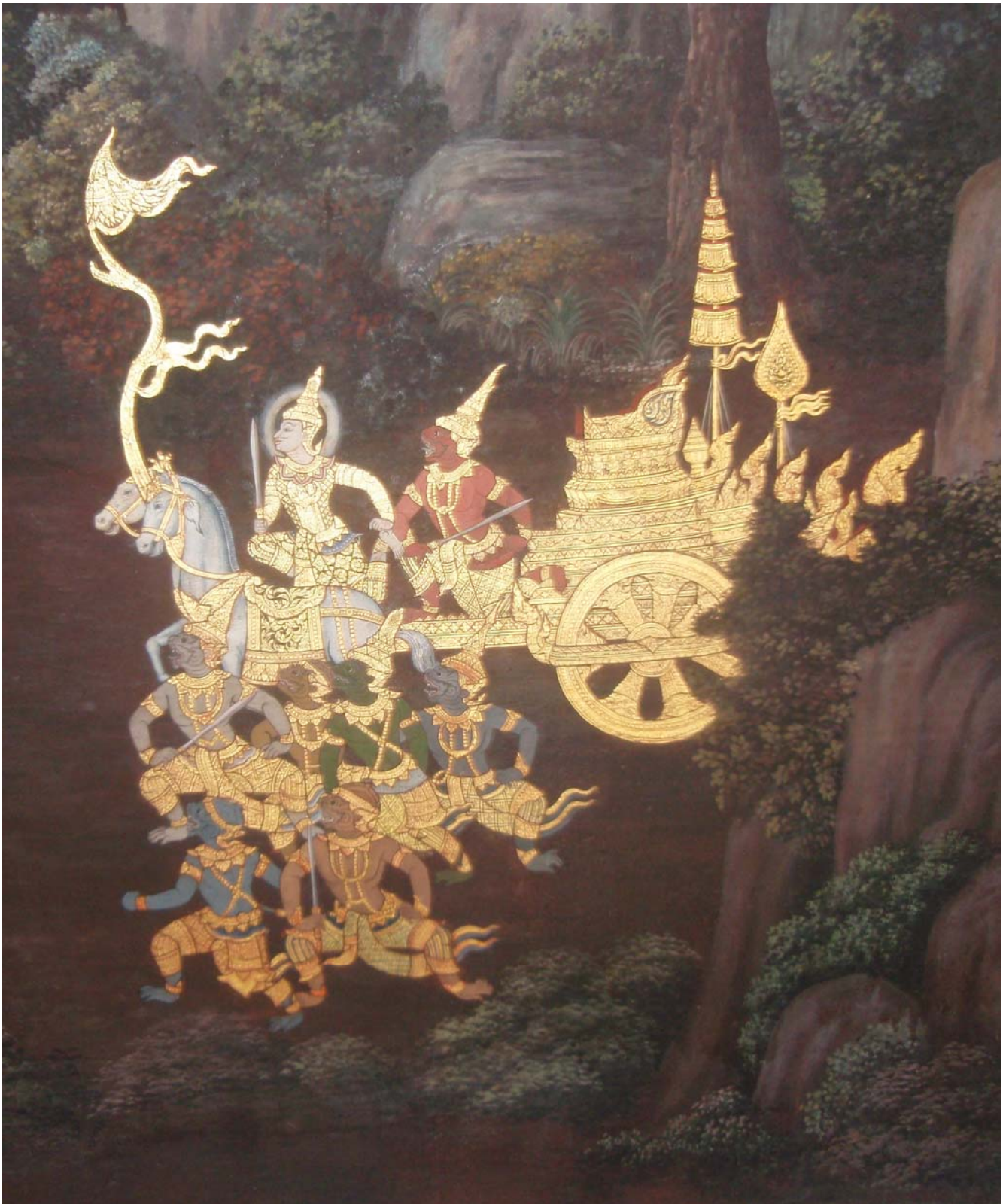
王宮／ワット・プラ・ケオの回廊の壁画