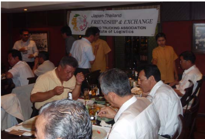
横幕の前で和気藹々と懇談する参加者