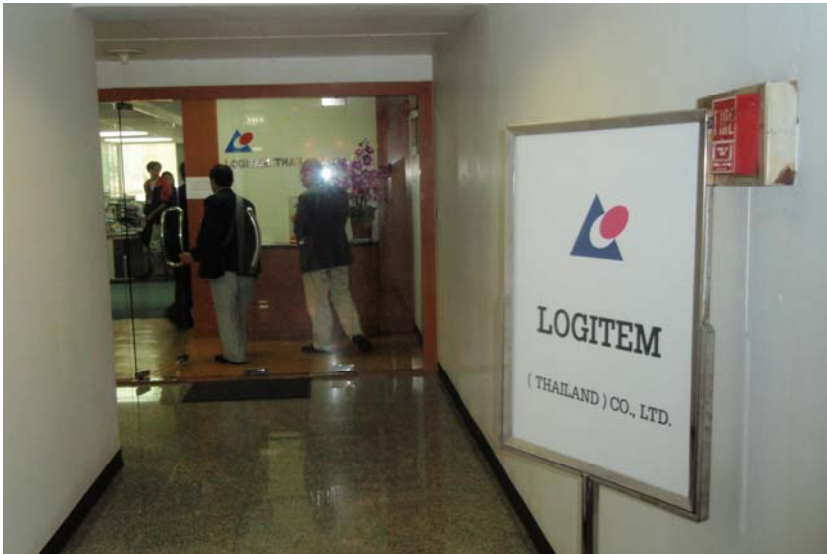
タイロジテムを訪問