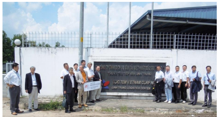
LOGITEM VIETNAM NO.2 HCM