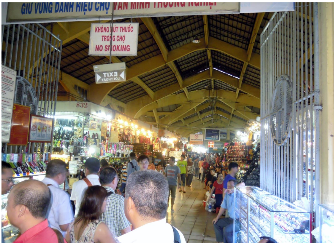
ベンダイ市場を視察