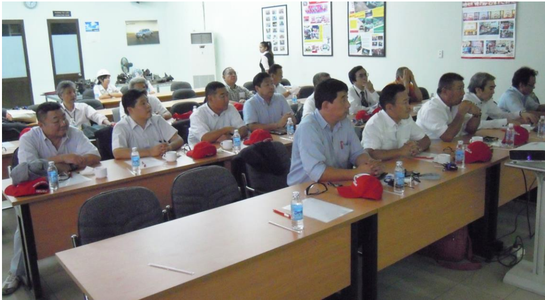
ISUZU VIETNAM CO.,LTD での研修