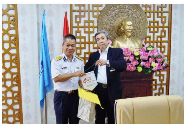
レ・トゥアン・アンハ副社長と松本本部長は、カットライ港記念メダルとロジスティクス研究会の記念ペナントを交換