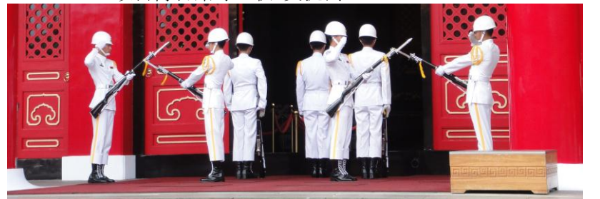
英霊が祭られる忠烈祠の衛兵交代