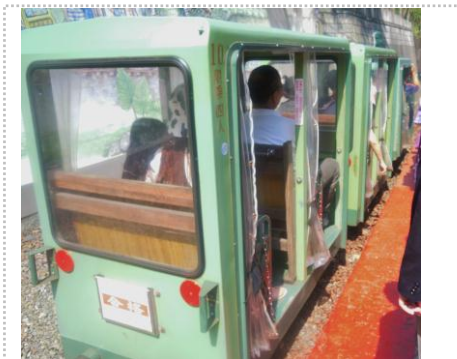
烏来から下る観光トロッコ

経験値とバイタリティーを持った先輩たちが多く、ぶつかっていくと何かしか必ず返してくれてる。とても、自分にとってプラスになることが多い組織です。そんなこともあり、また、こういう機会があれば参加したいですね。